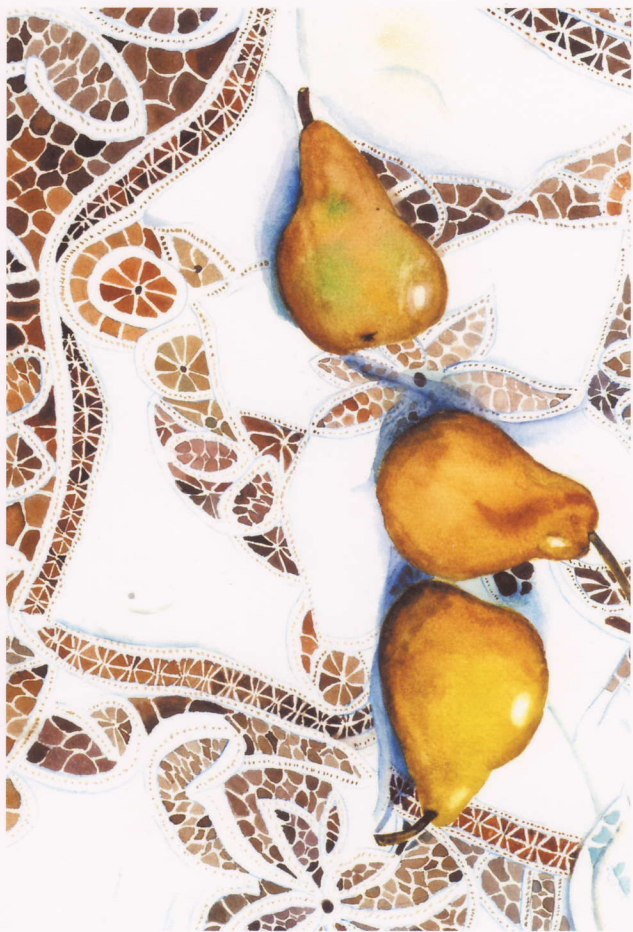
ペアとレースの布 公募展受賞作品 Migoko Mizuno